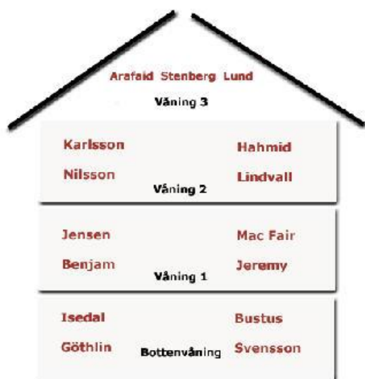
Ett exempel på ett flerfamiljshus med 15 st boende på 4 plan.

Börja längst ner till vänster med lägenheten på nedersta våningen. Gå sedan vidare uppåt kolumn för kolumn. Börja alltid längst ner.